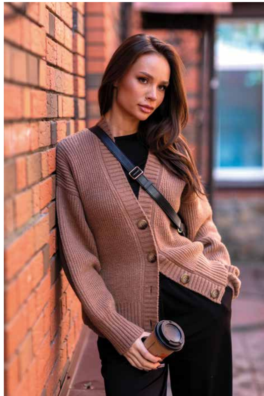
кардиган 245106 брюки 240704