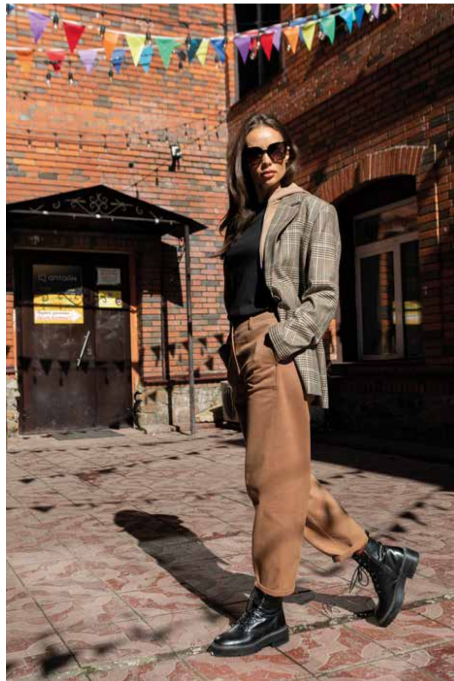
жакет 240124 брюки 240629