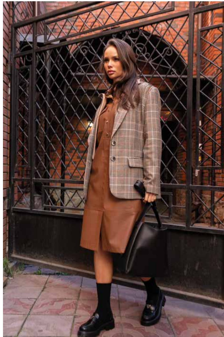
жакет 240124 платье 241116