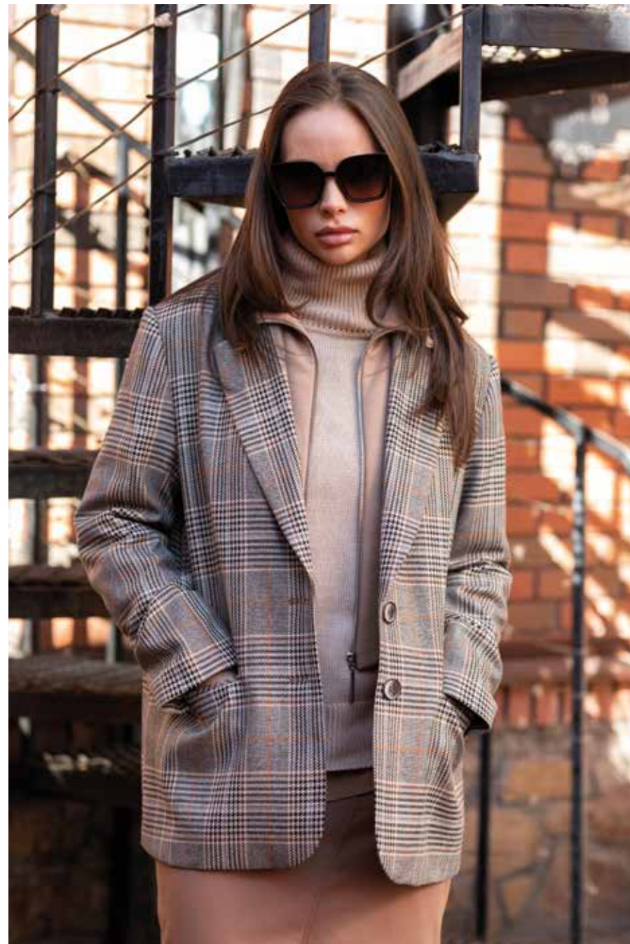
жакет 240124 свитер 246303 юбка 240428