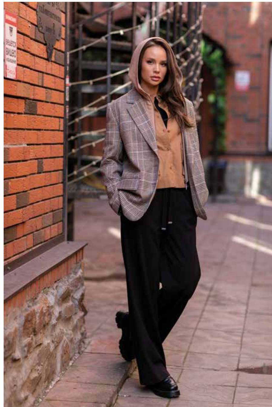
жакет 240124 блузка 240845 брюки 240704