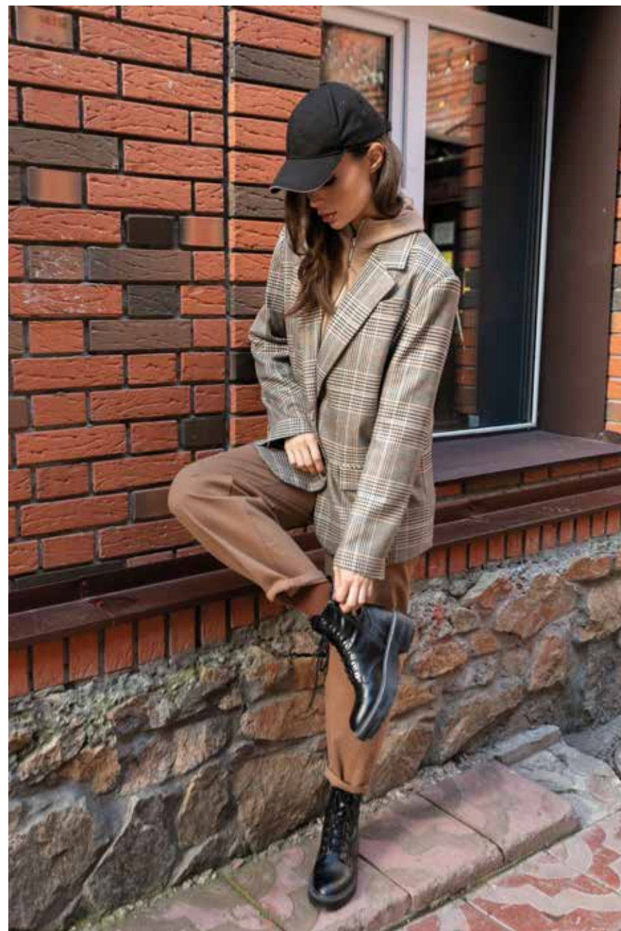
жакет 240124 брюки 240629