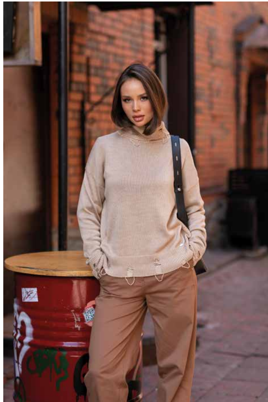
свитер 246304 брюки 240629