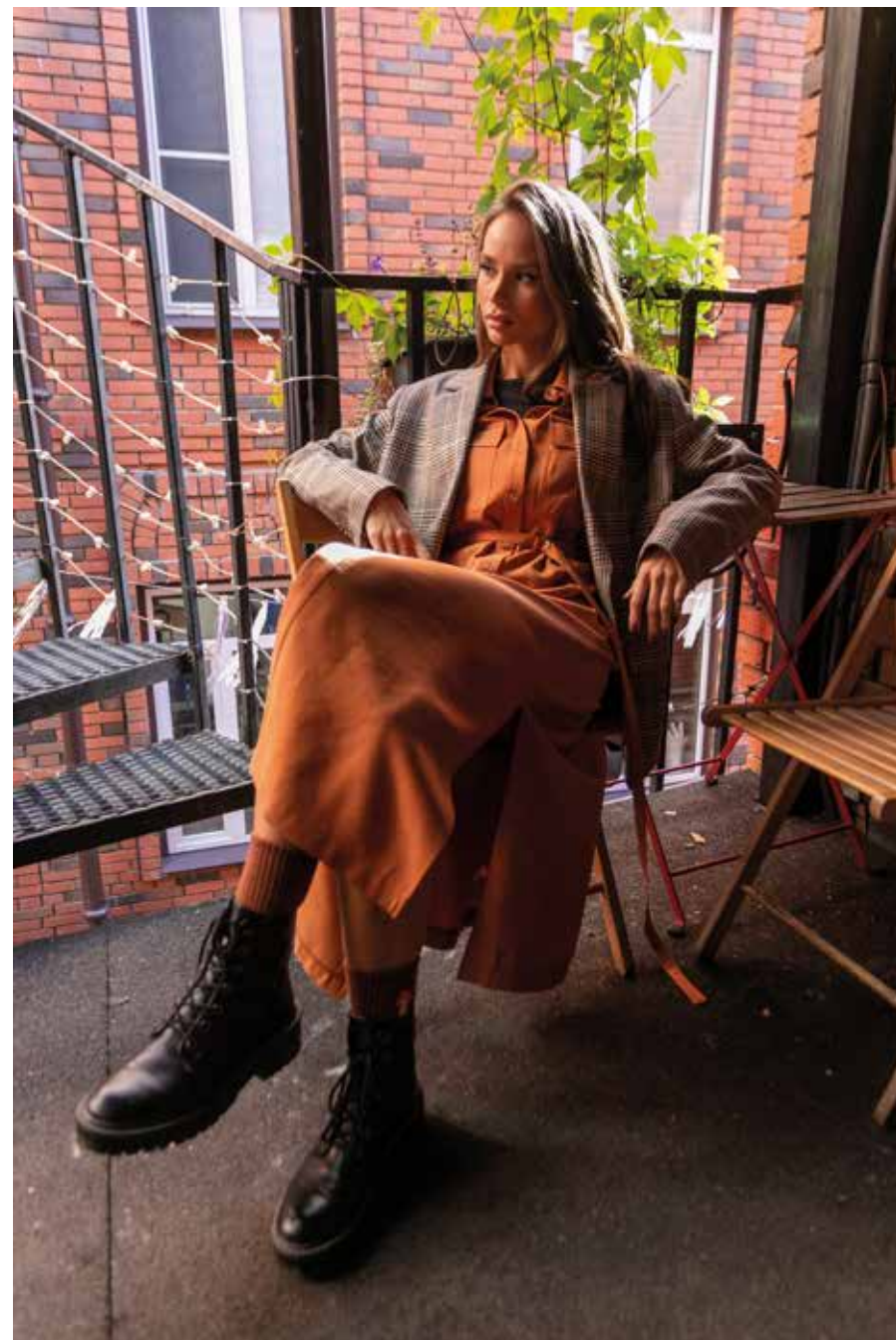
жакет 240124 платье 241055