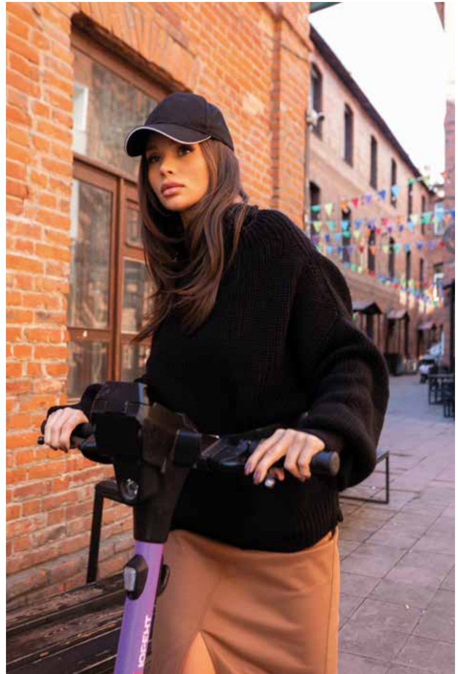
водолазка 225734 юбка 240428