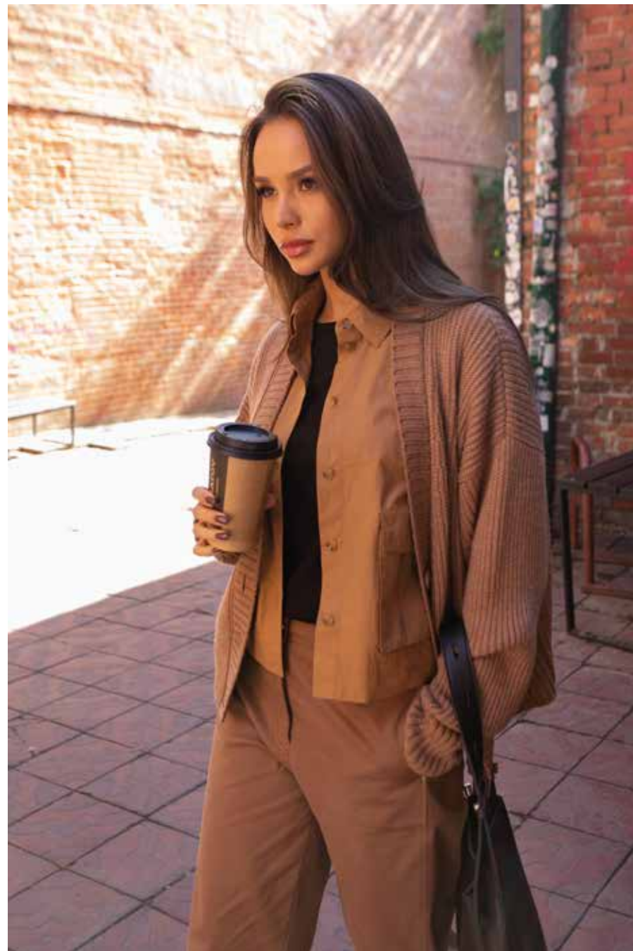
блузка 240845 брюки 240629